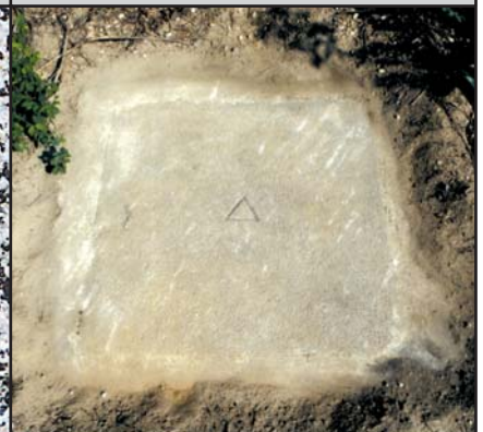
SFP Granitplatte 60 cm x 60 cm oder 80 cm x 80 cm