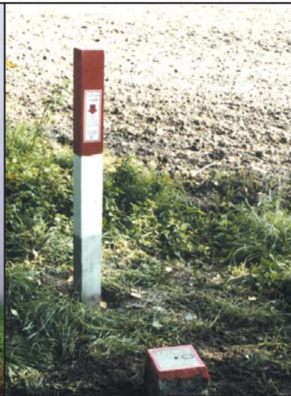
OP Granitpfeiler 16 cm x 16 cm mit Schutzsäule