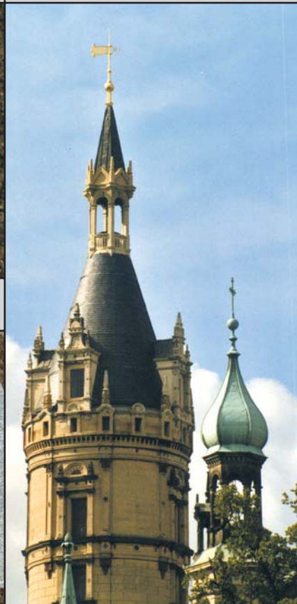
Hochpunkt (Turm Knopf u. a.)