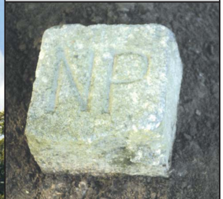
Markstein Granitpfeiler 16 cm x 16 cm mit „NP“