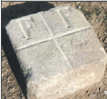
TP (Meckl.) Steinpfeiler bis 35 cm x 35 cm (auch mit Keramikbolzen)*