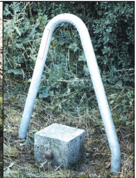
HFP Granitpfeiler 25 cm x 25 cm mit seitlichem Bolzen und Stahlenschutzbügel