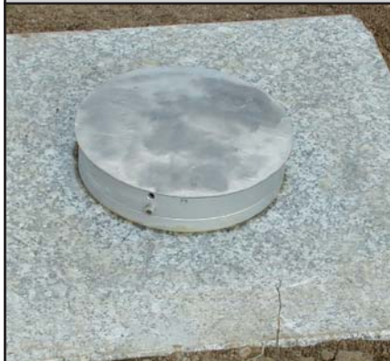
GGP Granitpfeiler 30 cm x 30 cm* oder 50 cm x 50 cm*