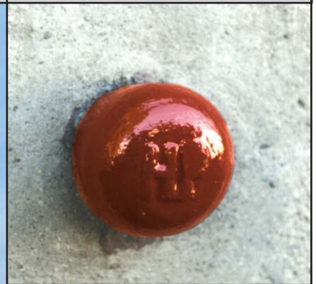
HFP Mauerbolzen (Ø 2 cm bis 5,5 cm) oder Höhenmarke