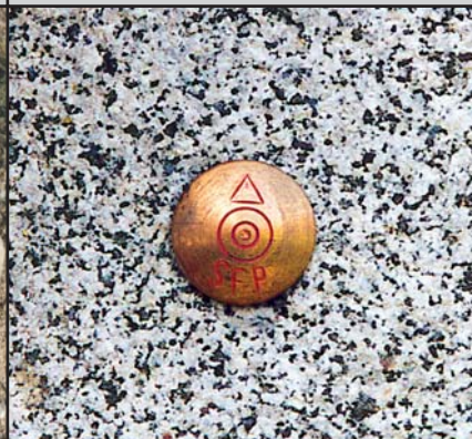
SFP Messingbolzen Ø 3 cm